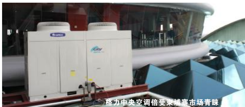
格力中央空调倍受柬埔寨市场青睐

本报讯 格力自进入柬埔寨以来,年销量已经突破4000套,位居柬埔寨空调销售的第二位。