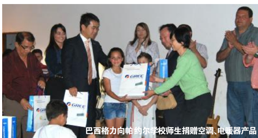
巴西格力向帕约尔学校师生捐赠空调、电暖器产品

帕约尔学校位于巴西污染最严重的铁特河流域。铁特河的污染不仅严重损害了当地居民的健康,也破坏了当地农业环境,导致居民收入来源中断而生活贫困,当地孩子只能依靠慈善机构的捐助时断时续地学习。格力(巴西)有限公司圣