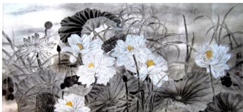
《墨荷》图/郑州格力 刘聪