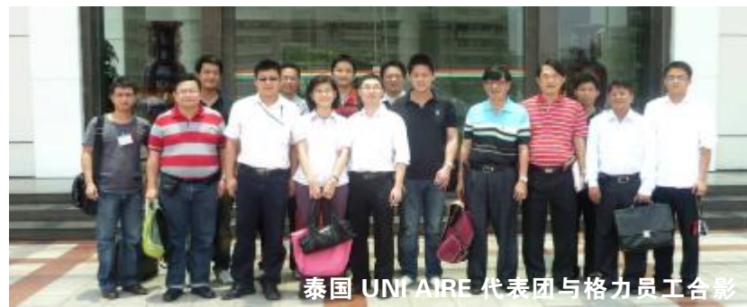
泰国 UNI AIRE 代表团与格力员工合影